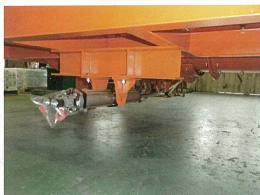
排出ゲート(シリンダ開閉)